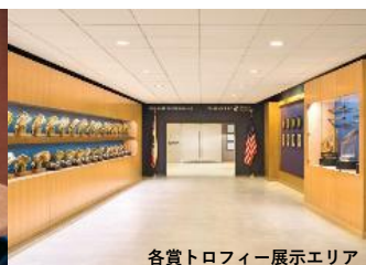
各賞トロフィー展示エリア